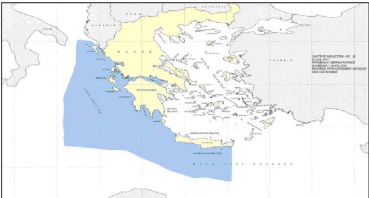
Πηγή: Επίσημη Εφημερίδα της Ευρωπαϊκής Ένωσης, «Λιθεθής δημόσια πρόσκληση υπ' αριθ. Δ1/20472/5.9.2011 για συμμετοχή