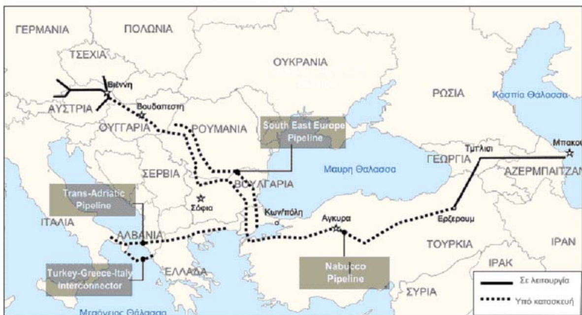
Χάρτης 1 : Αγωγοί μεταφοράς αζέρικου φυσικού αερίου στην Ευρώπη